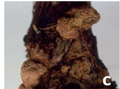
Figura 3. Síntomas producidos por la "corona de agallas" ( Agrobacterium tumefaciens ) en especies forestales. Costa Rica. a y c) Tectona grandis ; b) Gemilina arborea (Gamboa, 2009).